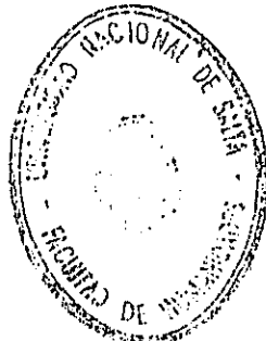
U.E. CAVACA PULGARCICH DEPARTAMENTO Facultad de Humanidades - UNCSA